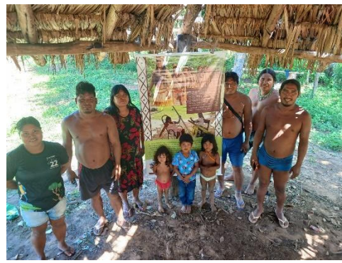
Fig 18: Entrega de Banners Sobre os Saberes tradicionais, Festa da “Menina Moça e Furação de Nariz” Povo Nambiquara, Terra indígena Sararé, aldeia Central. 15/03/2024