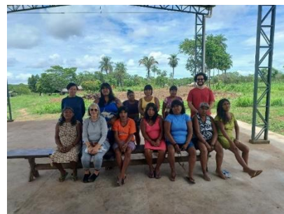
Fig 27: Reunião de validação devolutivas diagnóstico artesanato Aldeias TI Sararé. 10/12/2023