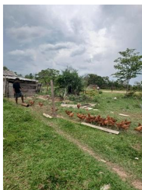
Fig 11: Produção de aves de corte, Terra Indígena Vale do Guaporé, Povo Nambiquara, Aldeia Mamaindê Central 06/12/2023

A atuação na aquisição de aves da aldeia Fazendinha (TI Portal do Encantado) foi concluída com sucesso. Além disso, foram adquiridos kits (aves, ração para todo ciclo até o abate, material para o galinheiro) com 50, 100 ou 200 aves para 15 aldeias da TI Vale do Guaporé e TI Sararé. Também foi construído um galinheiro na aldeia Cachoeira (subgrupo Mamaindê) da TI Vale do Guaporé. Todos os materiais, aves e ração necessários para os subgrupos Mamaindê e Negarotê foram adquiridos e entregues. No total, 17 aldeias foram beneficiadas com a produção de aves, com foco na subsistência.