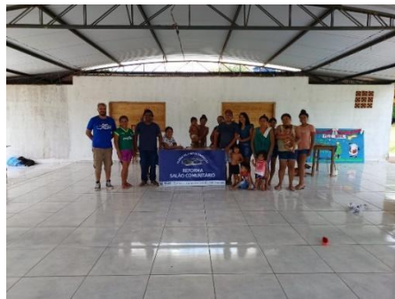
Fig 20: Entrega de Centro Coletivo Povo Chiquitano, Aldeia Vila Nova Barbecho 02/02/2024.