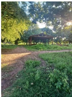
Fig 19: Entrega de Centro Coletivo Povo Chiquitano, Terra indígena Portal do Encantado, aldeia Paama.30/01/2024.

O principal escopo dessa atividade, consistiu em discernir a utilização potencial desses centros culturais para a promoção da identidade cultural local, o estímulo à atividade produtiva e a ampliação da participação das mulheres. Assim, mesmo diante dos entraves infraestruturais e logísticos observados na TI Vale do Guaporé, as atividades foram coordenadas de maneira estratégica, adaptando-se às circunstâncias emergentes e priorizando as intervenções mais factíveis em cada estágio do projeto.