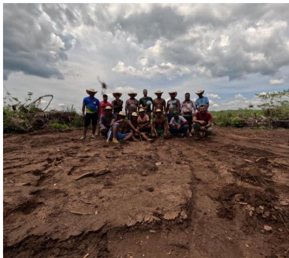
Fig 2: Equipe envolvida no mutirão de Plantio do SAF junto ao povo Nambiquara, TI Sararé, 09/12/2023