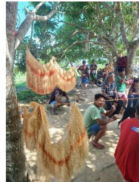
Fig 16: Devolutiva e validação do trabalho de diagnóstico Participativo sobre Artesanato, Terra indígena Vale do Guaporé Aldeia Buriti Negarotê .22/09/2023