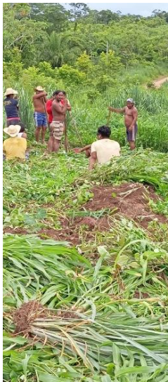
Fig 1: Equipe envolvida no mutirão de manutenção do SAF junto ao povo Nambiquara, TI Sararé, 17/01/2024

Apoio em 2 hectares Roças de toco na TI Vale do Guaporé Aldeia Nilo e Aldeia Lagoa dos brincos subgrupo Mamaindê. A roça de toco é uma prática agrícola tradicionalmente utilizada por diversos povos indígenas. Nesse método, a vegetação nativa é derrubada e queimada, deixando para trás os tocos das árvores. Em seguida, sementes são plantadas nos espaços entre os tocos, aproveitando os nutrientes deixados pelas árvores derrubadas. Essa técnica é uma forma de agricultura de subsistência, que permite às comunidades indígenas cultivarem alimentos básicos para sua alimentação, sem a necessidade de uso de agrotóxicos ou técnicas modernas de cultivo. A roça de toco está intimamente ligada à relação respeitosa e sustentável que os povos indígenas mantêm com a natureza e seus recursos, buscando sempre garantir a segurança alimentar de suas comunidades de maneira equilibrada e harmônica com o ambiente ao seu redor.