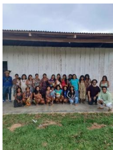
Fig 25: Reunião coleta de informações para diagnóstico artesanato, Povo Nambiquara, Terra Indígena Vale do Guaporé, Aldeia Mamaindê Central. 20/09/2023

Durante o período da consultoria, foram realizadas quatro visitas que permitiram observar uma significativa produção de artesanato, sobretudo no subgrupo Mamaindê, localizado na Terra Indígena (TI) Vale do Guaporé. Essa análise abarcou as Terras Indígenas Vale do Guaporé, Portal do Encantado e Sararé, sendo conduzida por meio de um diagnóstico elaborado em duas etapas distintas de visitas técnicas. As visitas, realizadas entre os meses de setembro e dezembro de 2023 sendo a primeira no período de 19 a 22/09/2023, teve como foco a minuciosa coleta de informações relevantes. Posteriormente, a segunda visita de 05 à 08/12/2023 foi direcionada para validar o diagnóstico elaborado.