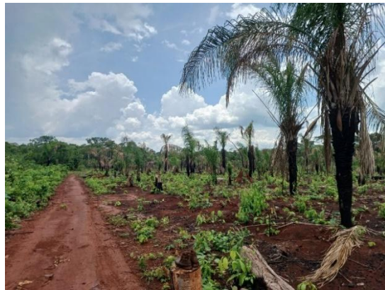
Fig 3: Área preparada para plantio Roça de tóco junto ao povo Nambiquara, TI Vale do Guaporé, Aldeia Mamaindê 06/12/2023

Nas comunidades de Vila Bela da Santíssima Trindade, mais precisamente em Jardim Aeroporto e Nova Fortuna, foram realizadas atividades de capacitação focadas na produção agroecológica. Essas iniciativas proporcionaram conhecimentos essenciais para o desenvolvimento de práticas agrícolas sustentáveis. Além disso, foram disponibilizadas mudas e sementes, contribuindo significativamente para ampliar a produção de alimentos voltados à subsistência.