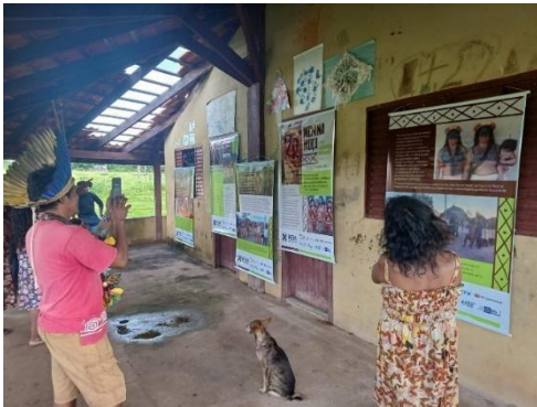
Fig 15: Entrega de Banners Sobre os Saberes tradicionais, Festa da “Menina Moça” Povo Nambiquara, Terra indígena Vale do Guaporé, aldeia Central Mamaindê. 01/02/2024

Nesta atividade foram realizadas 4 visitas presenciais entre 05 e 07/12/2023 com a presença da equipe técnica do projeto e um consultor contratado, onde foi possível observar que existem cantos, rituais, pinturas, artesanatos, danças e outras atividades que são realizadas nos territórios apoiados. Esta atividade contemplou as Terras Indígenas: Vale do Guaporé, Portal do Encantado e Sararé e o material produzido poderá ser utilizado nas escolas dessas e de outras terras indígenas dos respectivos povos.