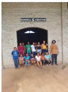
Fig 26: Reunião de validação devolutivas de diagnóstico artesanato, Aldeias TI Portal do Encantado. 07/12/2023