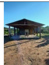
Fig 24: Cozinha Coletiva para beneficiamento de produtos de origem animal e vegetal, Povo Chiquitano, Terra indígena Portal do Encantado, Aldeia Fazendinha. 02/02/2024