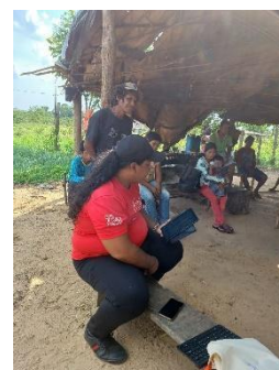
Fig 31: reunião de Monitoramento REM, Povo Nambiquara, Terra Indígena Vale do Guaporé Aldeia Negarotê Central.23/10/2023