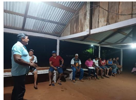
Fig 21: Entrega de Centro Coletivo Povo Chiquitano, Comunidade Nova Fortuna 23/09/202.