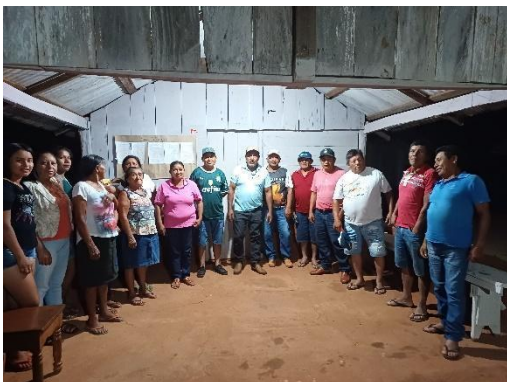
Fig 4: Capacitação de produção de base agroecológica Povo Chiquitano, Comunidade Nova Fortuna. 23/09/2023

Por outro lado, nas comunidades de Bokaina, Nossa Senhora Aparecida e Santa Mônica, foi efetuada a aquisição de mudas, sementes e ferramentas, com o propósito de viabilizar a implementação de quintais produtivos nas residências das famílias locais. Essa abordagem visa fortalecer a autonomia e a segurança alimentar dessas comunidades, proporcionando os meios necessários para que possam cultivar alimentos de maneira eficiente e sustentável em seus próprios espaços.