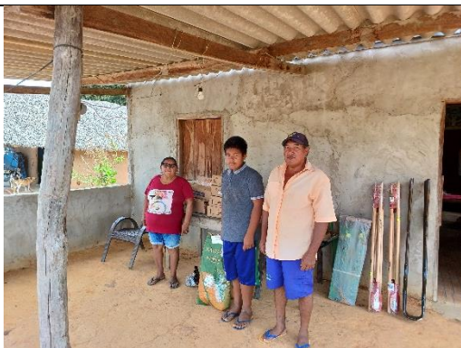
Fig 6 Entrega de Material de produção e manutenção de roças de toco Comunidade de Obis. Povo Chiquitano. 20/08/2023