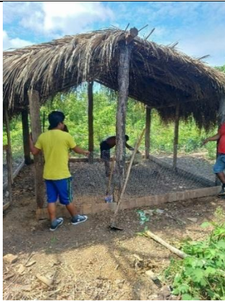
Fig 13: Entrega de Aves e insumos para produção animal de pequeno porte, Terra indígena Sararé Povo Nambiquara, Aldeia Central. 12/12/2023