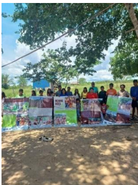
Fig 17: Entrega de Banners Sobre os Saberes tradicionais, Festa da “Menina Moça” Povo Nambiquara, Terra indígena Vale do Guaporé, aldeia Central Negarotê. 21/09/2023