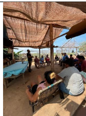
Fig 7 Capacitação produção de base agroecológica, Povo Chiquitano Jd Aeroporto. 29/09/2023