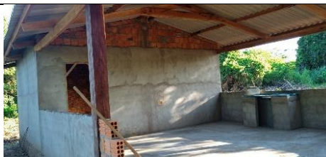
Fig 22: Cozinha Coletiva para beneficiamento de produtos de origem animal e vegetal, Povo Chiquitano, Terra indígena Portal do Encantado, Aldeia Acorizal. 02/02/2024