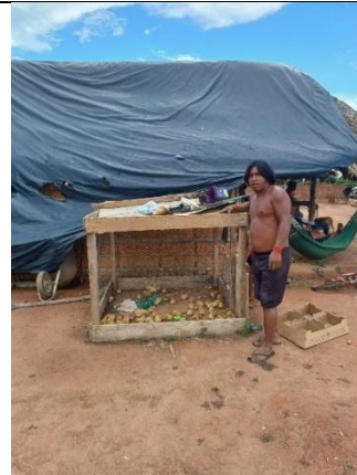
Fig 14: Entrega de Aves e insumos para produção animal de pequeno porte, Terra indígena Sararé Povo Nambiquara, Aldeia Figueira. 12/12/2023