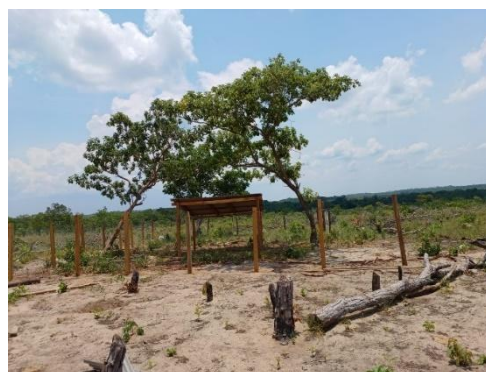
Fig 12: Construção de Galinheiro para produção de aves de cortes, Terra indígena Vale do Guaporé Povo Nambiquara, Aldeia Cachoeira Mamaindê. 24/10/2023