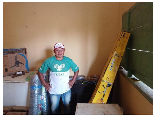
Fig 5: Entrega de Material de produção e manutenção de roças de tóco Comunidade de Bokaina, Povo Chiquitano. 18/08/2023