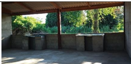
Fig 23: Cozinha Coletiva para beneficiamento de produtos de origem animal e vegetal, Povo Chiquitano, Terra indígena Portal do Encantado, Aldeia Acorizal. 02/02/2024