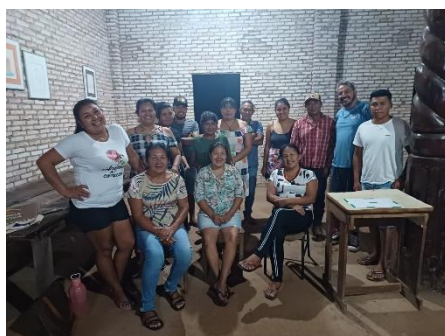
Fig 30: reunião de Monitoramento REM, Povo Chiquitano, Terra Indígena Portal do Encantado.26/10/2023