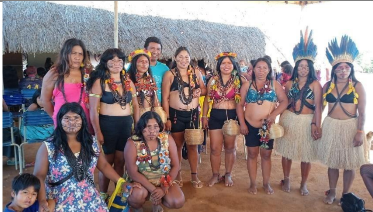
Fig 28 Encontro de Mulheres Xingu e Vale do Guaporé