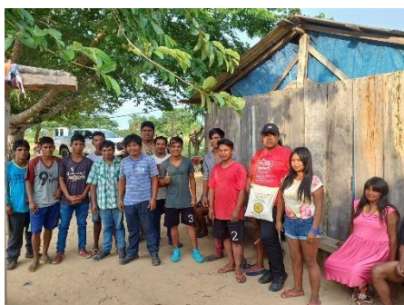
Fig 29: reunião de Monitoramento REM, Povo Nambiquara, Terra Indígena Vale do Guaporé Aldeia Mamaindê Central.24/10/2023

A atividade de monitoramento e avaliação demonstra um compromisso contínuo com o acompanhamento do progresso do projeto, a identificação de desafios e oportunidades, e a busca por soluções que atendam às necessidades das comunidades indígenas envolvidas.